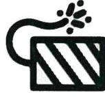
Tout feu d'artifice, pétard, fusées de défilé, briques allume feu, gaz lacrymogène, pistolet factice...