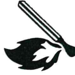
Briquet, allumettes, petits combustibles