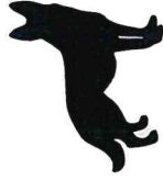
Animaux (Sauf chiens d'aveugles)